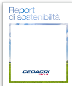
Cedacri S.p.A. Report di Sostenibilità con GRI G4 su dati 2016 e collegamenti con SDGs | 2017