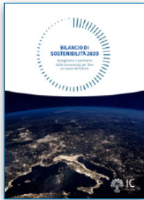
InfoCamere S.p.A. Bilancio di Sostenibilità con GRI Standards, Story telling, versione Web, su dati 2020 | 2021