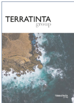
Terratinta Group Spa SB Report di Sostenibilità con Stakeholder Engagement su dati 2020 | 2021