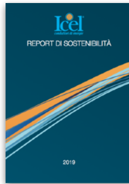
ICEL S.C.p.A. 1° Report di Sostenibilità GRI con Stakeholder Engagement su dati 2019 | 2020