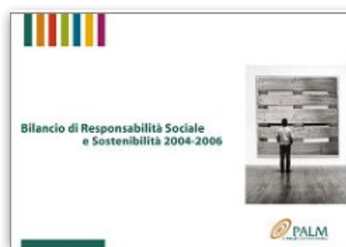
Palm S.p.A. Supporto alla realizzazione del 1° Bilancio di Sostenibilità con criteri GRI 3 | 2007