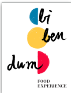
Bibendum Group srl SB Report di Sostenibilità su dati 2020 | 2021