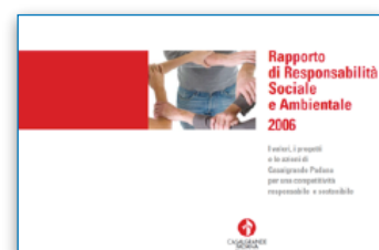
Casalgrande Padana S.p.A. Report di Sostenibilità con criteri GRI G3 2007