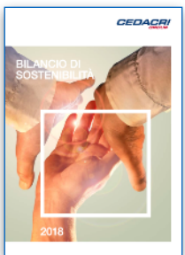
Cedacri S.p.A. Bilancio di Sostenibilità con GRI Standards con attività di Stakeholder Engagement e SDGs su dati 2018 | 2019