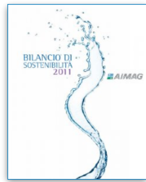
Aimag S.p.A. Attività di Stakeholder Engagement di supporto al Bilancio di Sostenibilità. Premio Oscar di Bilancio. 2011