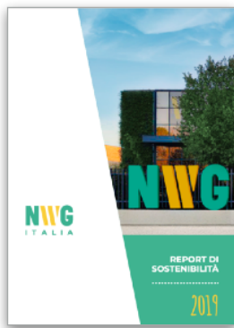
NWG Energia S.p.A. Report di Sostenibilità, Stakeholder Engagement su dati 2020 | 2021