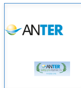
Anter ass. nonprofit Bilancio Sociale con analisi delle attività in coerenza con SDGs | 2021