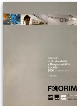
Florim S.p.A. Definizione Policy, redazione Bilancio di Sostenibilità con criteri GRI | G3 | 2008