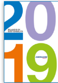
Cedacri S.p.A. Bilancio di Sostenibilità con GRI Standards con attività di Stakeholder Engagement e SDGs su dati 2019 | 2020