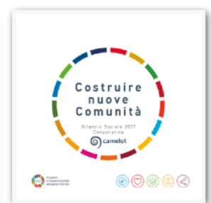
Camelot Coop. Soc. Bilancio Sociale con analisi delle attività in coerenza con SDGs | 2017