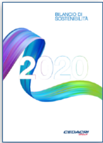
Cedacri S.p.A. Bilancio di Sostenibilità con GRI Standards con attività di Stakeholder Engagement e SDGs su dati 2020 | 2021