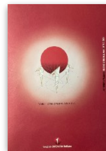
Unicredit spa Stakeholder Engagement per Bilancio di Sostenibilità | 2002