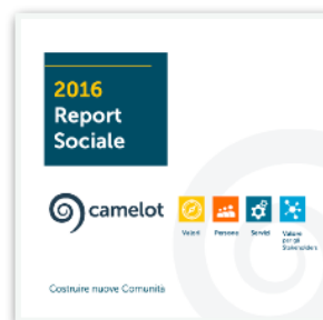
Camelot Coop. Soc. Bilancio Sociale con analisi delle attività in coerenza con SDGs | 2016