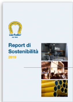
Socfeder S.p.A. Realizzazione del 1° Report di Sostenibilità con attività di Stakeholder Engagement | 2020