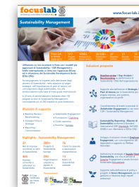
Schede Servizi www.focus-lab.it