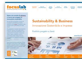
Portfolio progetti www.focus-lab.it