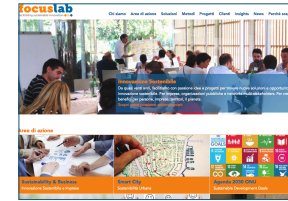
Sito Web www.focus-lab.it