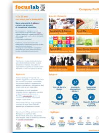
Company profile Scarica pdf